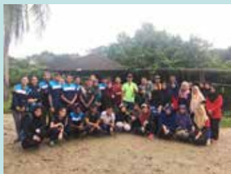
Pelancaran Projek Mudball