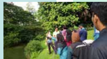
Pelancaran Rasmi Projek KRP Riverdale oleh TNCHEP