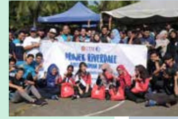
Pelancaran Rasmi Floating Wetland bersama rakan kerjasama