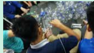
Pengumpulan Botol Plastik (Recycling Program)