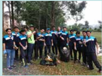
Gotong Royong Sungai KRP