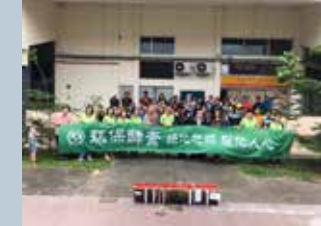
Eco- Enzyme Workshop