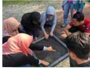
Projek Floating Wetland