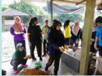
Projek Mudball (Fasa 2 dan Fasa 3)