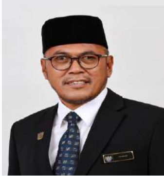
Penampilan khas: Yang Berhormat Datuk Pandak bin Ahmad Jawatan :